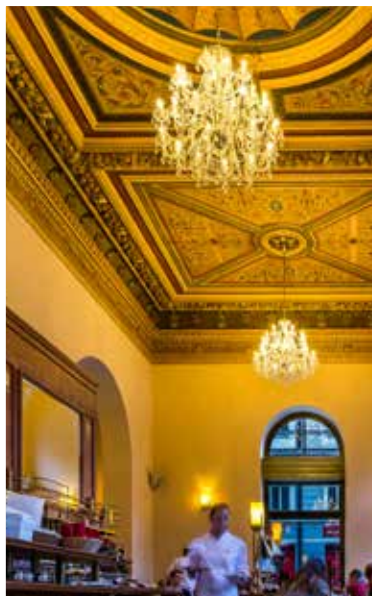
STILIG: Den originale, men nyrestaurerte himlingen på Café Savoy er verdt et besøk i seg selv. Det er også maten, vinlisten og stemningen.