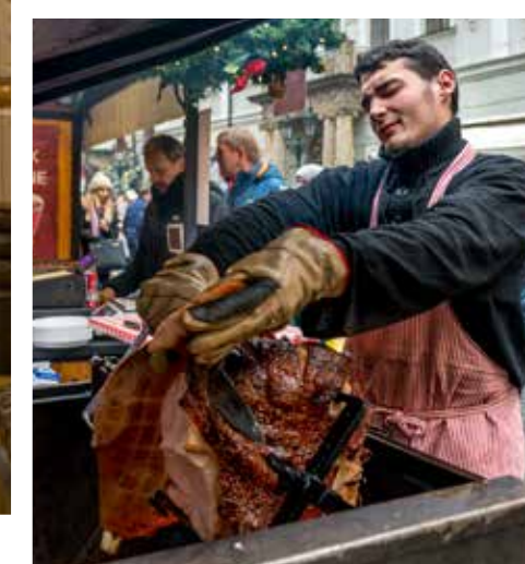
FRISTENDE: Den nygrillede pragerskinke serveres med sennep og pepperrot og lukter vidunderlig.

Den lave vintersolen makter ikke lenger å fargelegge byen, men gjør en siste kraftanstrengelse idet den forsvinner over horisonten. Byen med de hundre spir har gjenoppstått i en menneskeskapt lysdrakt.