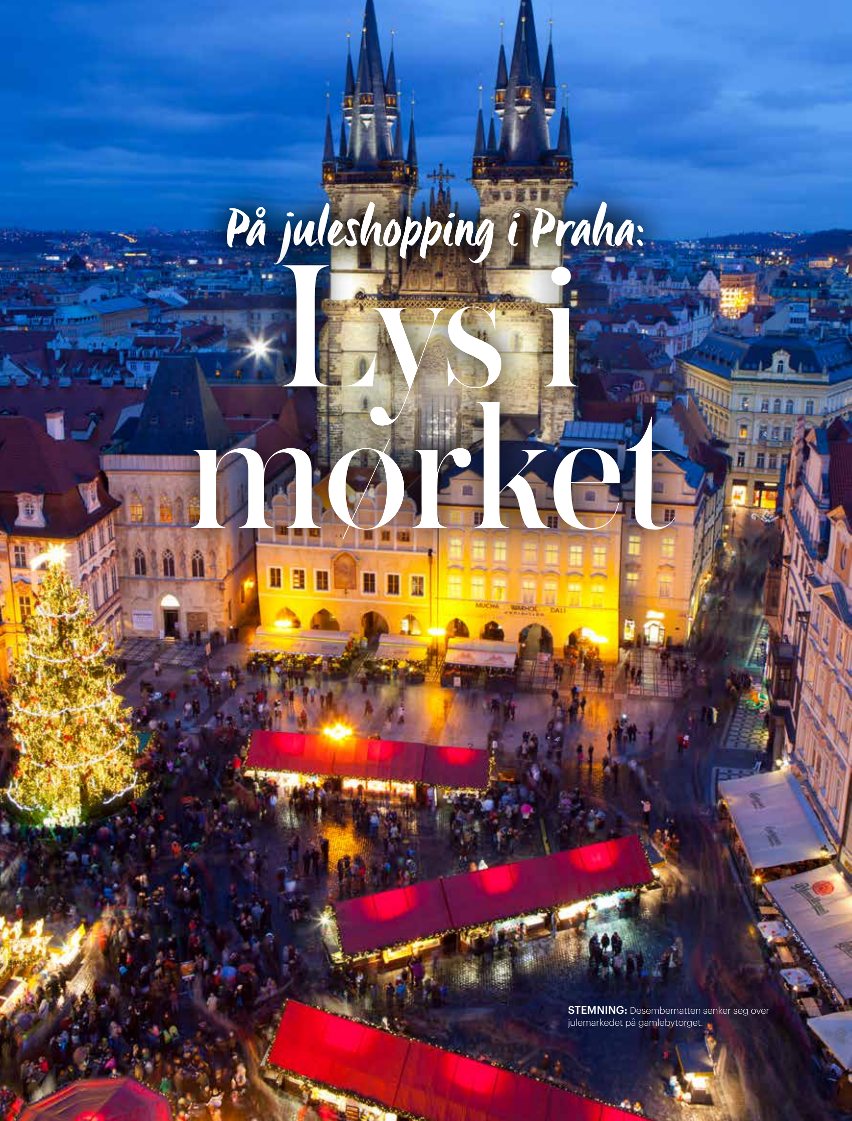
STEMNING: Desembermatten senker seg over julemarkedet på gamlebytorget.